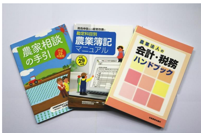
農業の専門誌「全国農業図書」