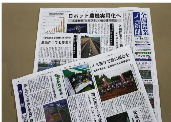
全国農業新聞は農業者などへ身近な情報を提供します

農村現場では、全国農業新聞が発信するこれら情報を利用して農業委員と農業者、地域住民の話し合いが進められています。